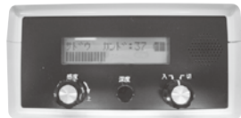
受信器操作パネル